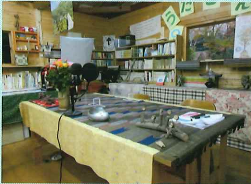
ぶどうの会交流会オンラインスタジオ